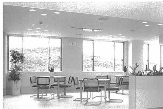
食堂・デイルーム