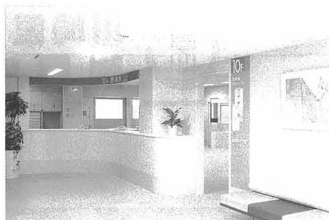
ナースステーション